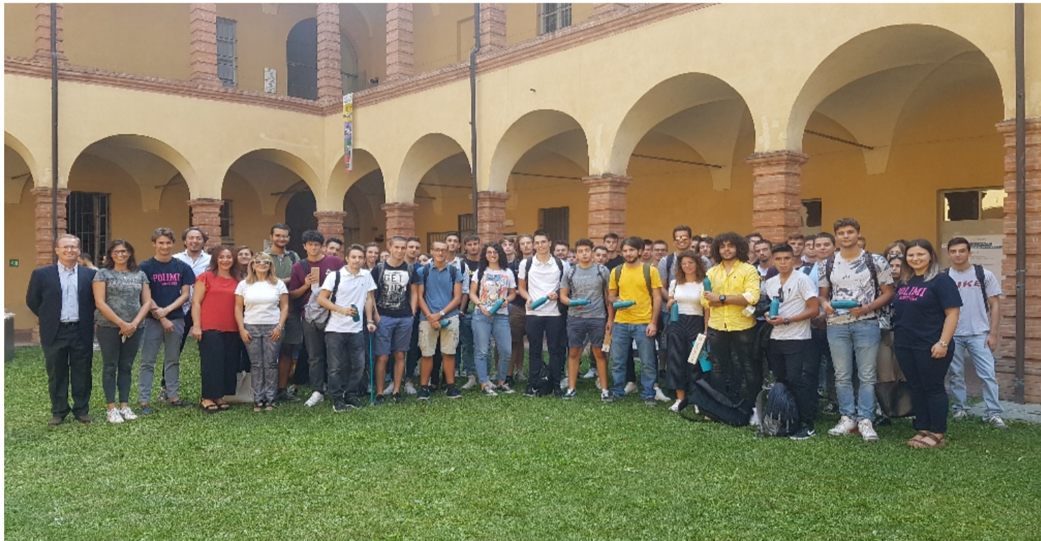
L'accoglienza delle matricole del corso di laurea in Ingegneria Meccanica, lo scorso 16 settembre, presso il Polo di Piacenza